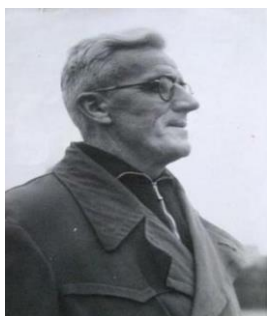
Karl Schelenz, criador do handebol, chamado de torball .

Nesse ano, ele e outros parceiros de trabalho reformularam um esporte para deficientes visuais